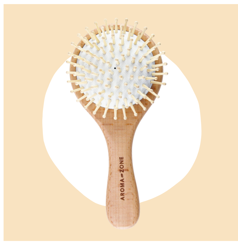
Brosse à cheveux en bois de hêtre - 5,90€