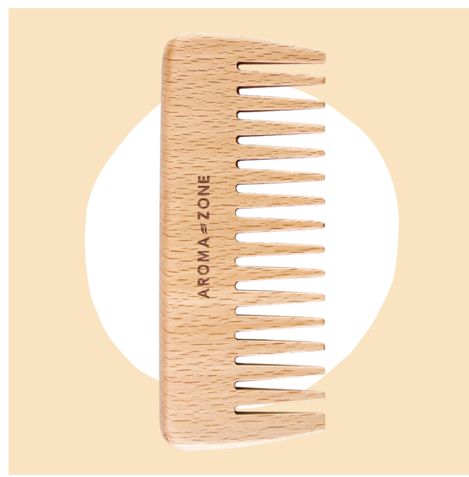
Peigne démêlant en bois de hêtre - 4,90€