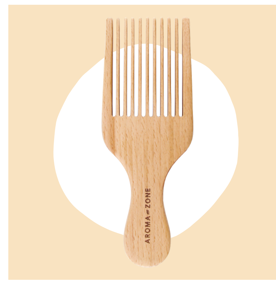
Peigne volume boucles en bois de hêtre - 6,90€

AROMA = ZONE EXPERT NATUREL EN SOINS & BEAUTÉ